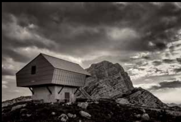
Simon Krejani: Bivak na Prehodavcih