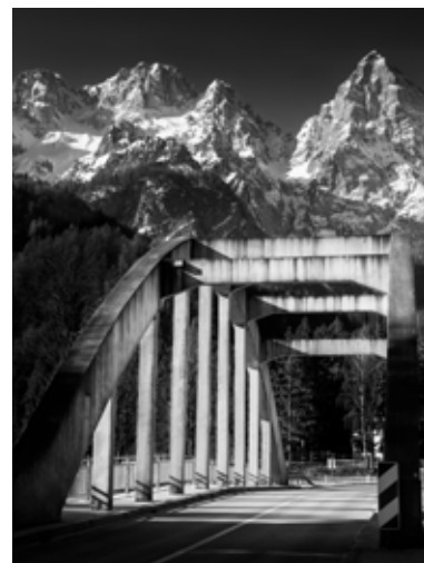
Saša Slamnik: Most pod Špikom