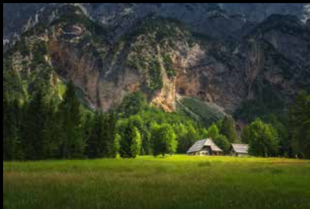
Alaš Komovec: Trentarska