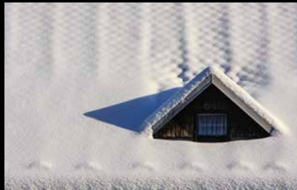
Stanislav Perko: Pod belo odejo